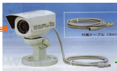
屋外用カラー監視カメラ（赤外線内蔵）