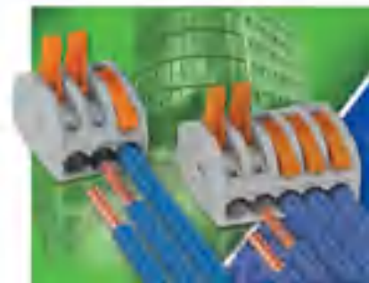
0.08 ~ 2.5 mm 2 多接続型 @70