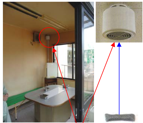
脱臭機能付エコシルフィ (PIP 自然触媒内臓)