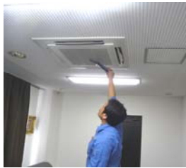
パッケージエアコンで測温中