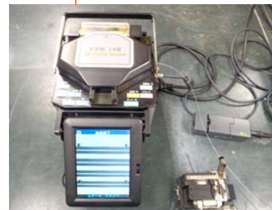
光ケーブル接続機にて接続