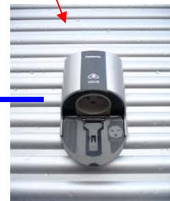
充電コンセント(開)