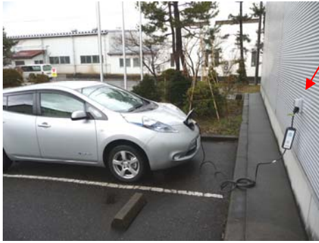
E工業様 電気自動車充電中(80% 8時間)