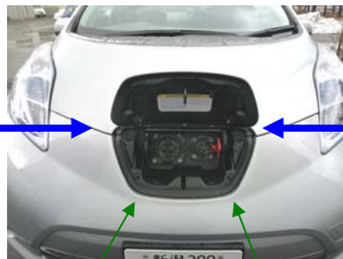
急速、中速用給電口