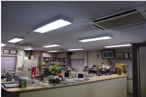
FLR40-2×11台+FHF63×2台 962W 照度576lx