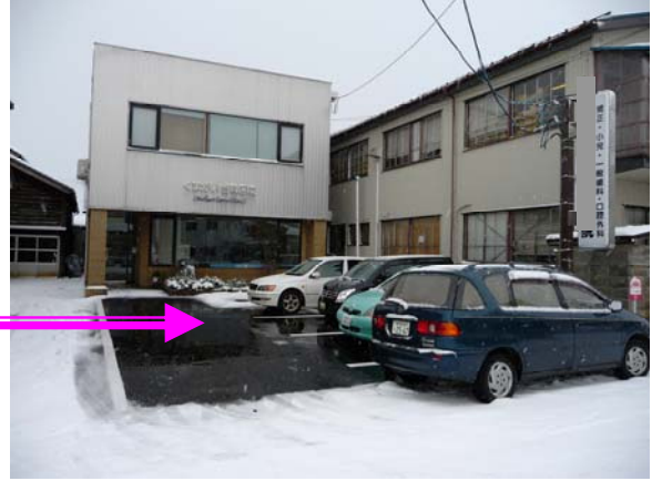
K 歯科医院消雪状況 (78㎡)