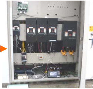
最大5回路1000Aまで計測できます(1ヶ月)