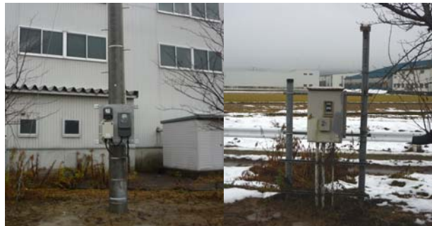
第2融雪引込 及び 制御盤

○思いがけない負荷の使用が分かる事もあります。適切なデマンド管理(省エネ提案)のために計測をお勧めします