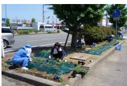
今年も美化運動に参加しています

● 今月のマル得情報 アクセスによるデータベースの解決策でお困りの方は解決策を共有しましょう