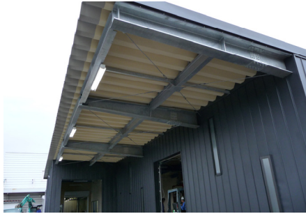
T 社倉庫下屋 LED 照明