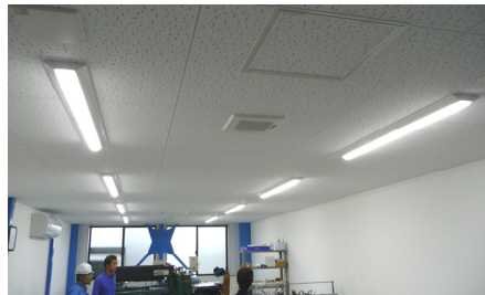
T 社事務所 LED 照明