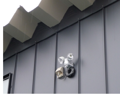
壁面投光器型 LED 照明