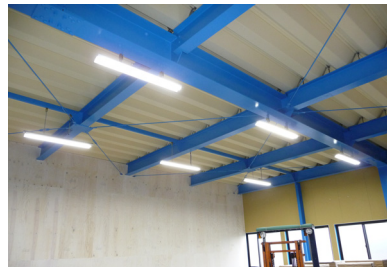
倉庫 LED 照明