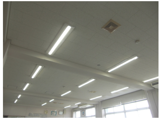
上林小学校（直付型）