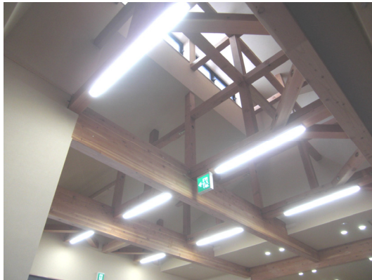
かんきょう庵（直付型）