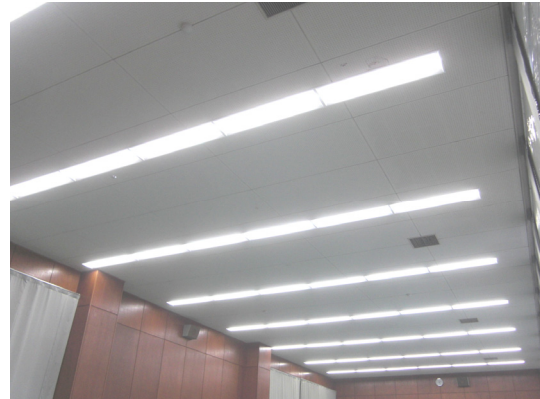
総合体育館（埋込型）