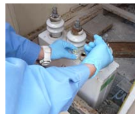
コンデンサから採油