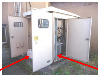
コンデンサ トランス