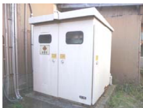
K社 屋外キュービクル