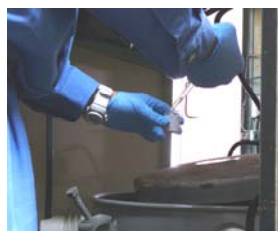
トランスから採油