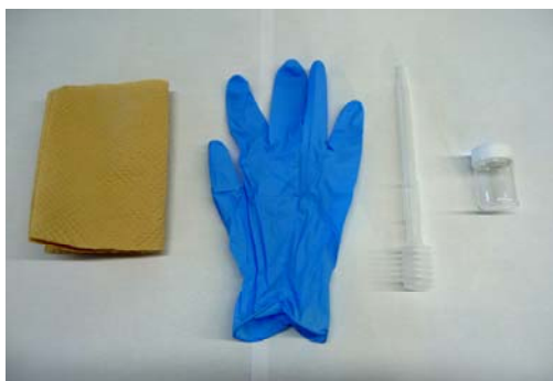
検査キット (油吸収紙、手袋、スポイト、検査用ビン)