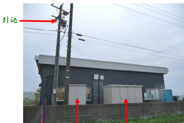
H社用キュービクル