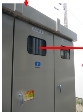
引込キュービクル(F社)