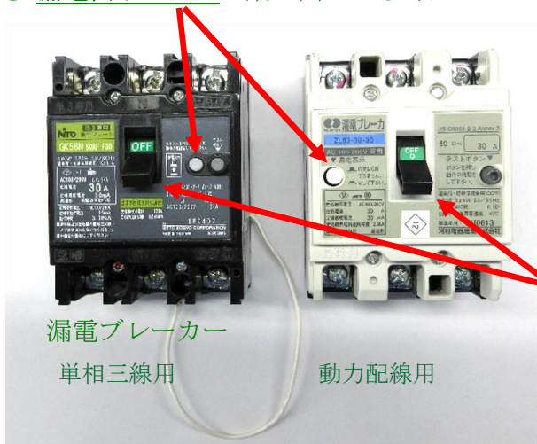
漏電ブレーカー 単相三線用

○ 漏電表示ボタン が飛び出ている時はボタンを押してからブレーカーを入れてください