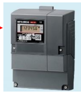
スマートメーター